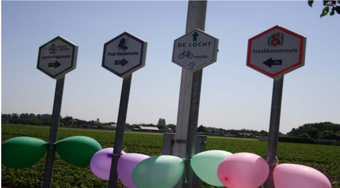
Foto Landschap Horst aan de Maas

Op de foto de geopende fietsroutes (nieuwe en aangepaste routes)