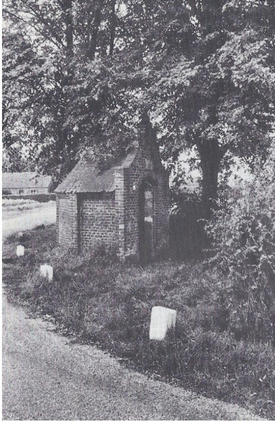
Kapel "t Heiligenhuuske"