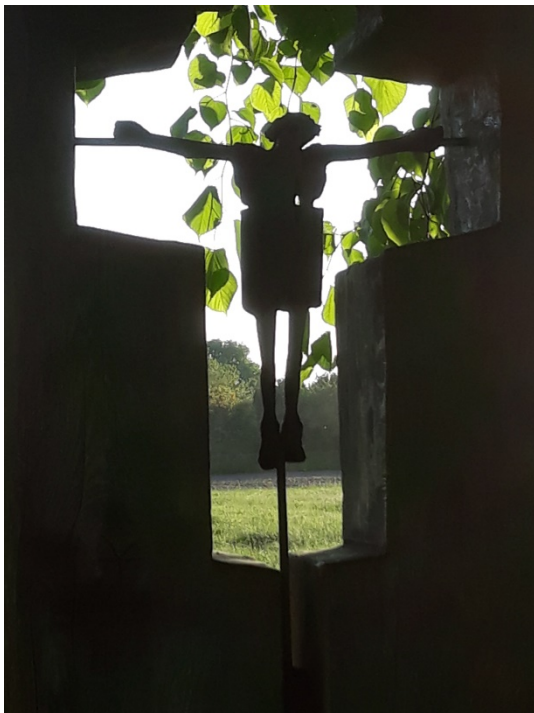
Corpus in kruis