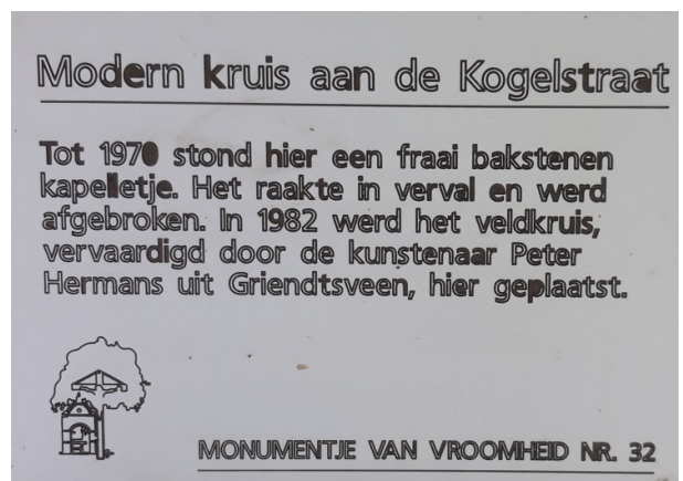
Tekst bij kruis Kogelstraat