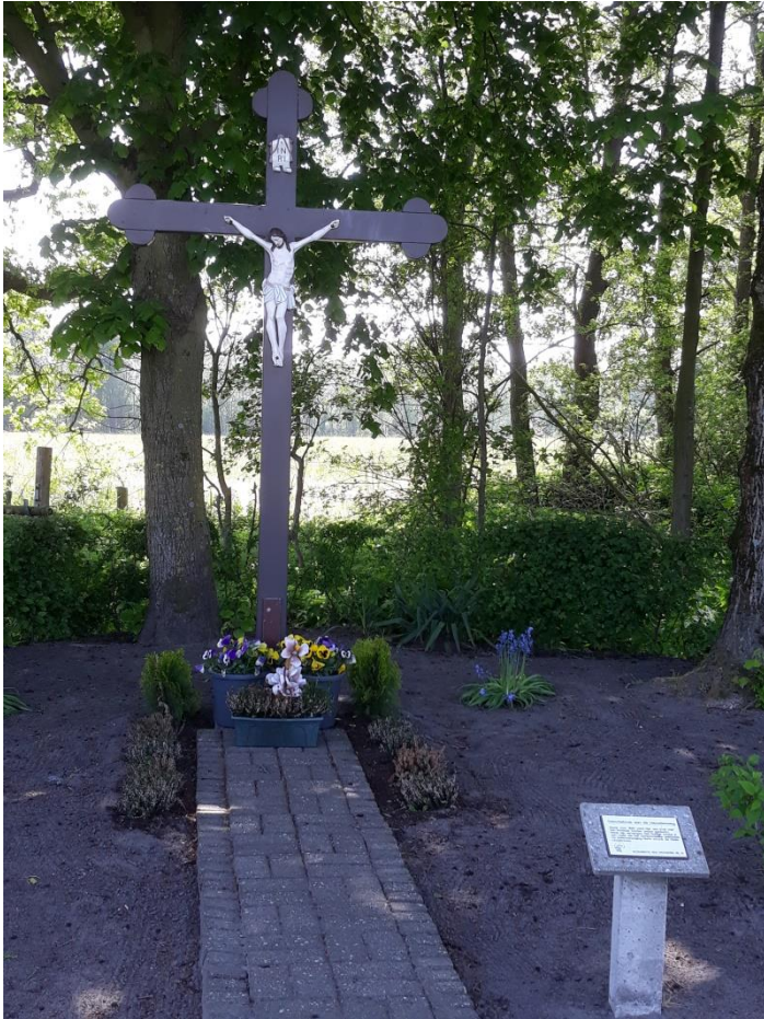
Devotiekruis aan de Hesselenweg