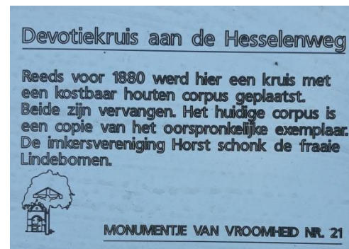
Tekst bij devotiekruis